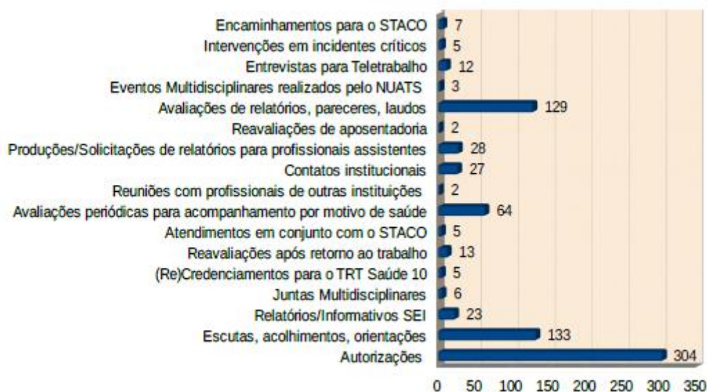
Gráfico de Procedimentos Psicológicos

O total de atendimentos realizados pela equipe de Psicologia do Núcleo de Atenção à Saúde foi de 519, sendo utilizados os itens 1, 2, 6, 8 e 16